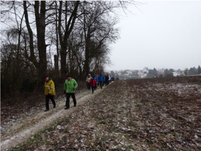
ging's durch den Wald steil hinab nach Alling.